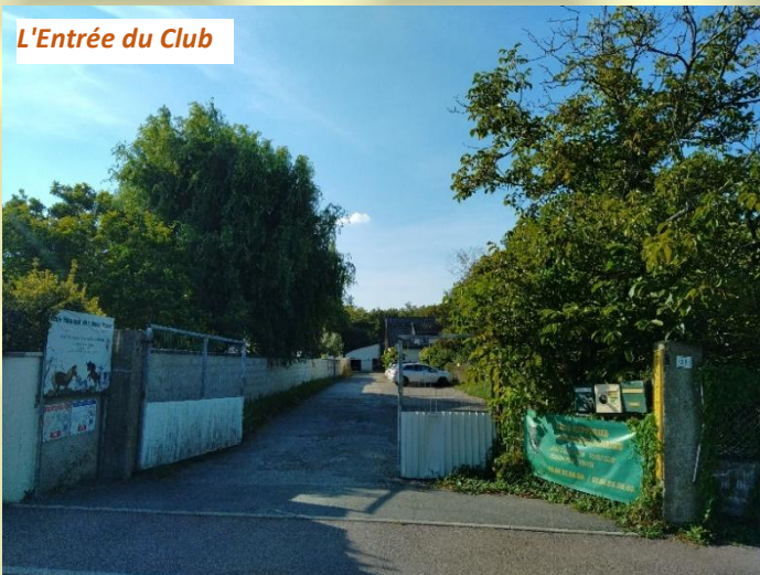
L'Entrée du Club

Imprimé par nos soins ne pas jeter sur la voie publique